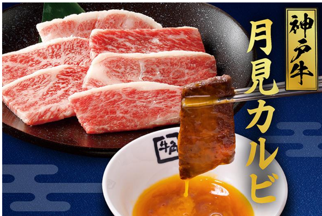
■神戸牛月見カルビ 730円（税込803円）

コロナグループの株式会社レイズインターナショナルが展開する牛角では、2022年9月8日(木)から10月31日(月)までの期間限定で、「秋の牛角フェア」を実施します。贅沢な神戸牛の月見カルビ、熟成厚切りカルビの月見カルビ、たっぷりチーズをかけた石焼ビビンバ、旨味たっぷり芳醇しじみラーメン、くちどけなめらかなモンブランアイスの5種メニューを販売します。