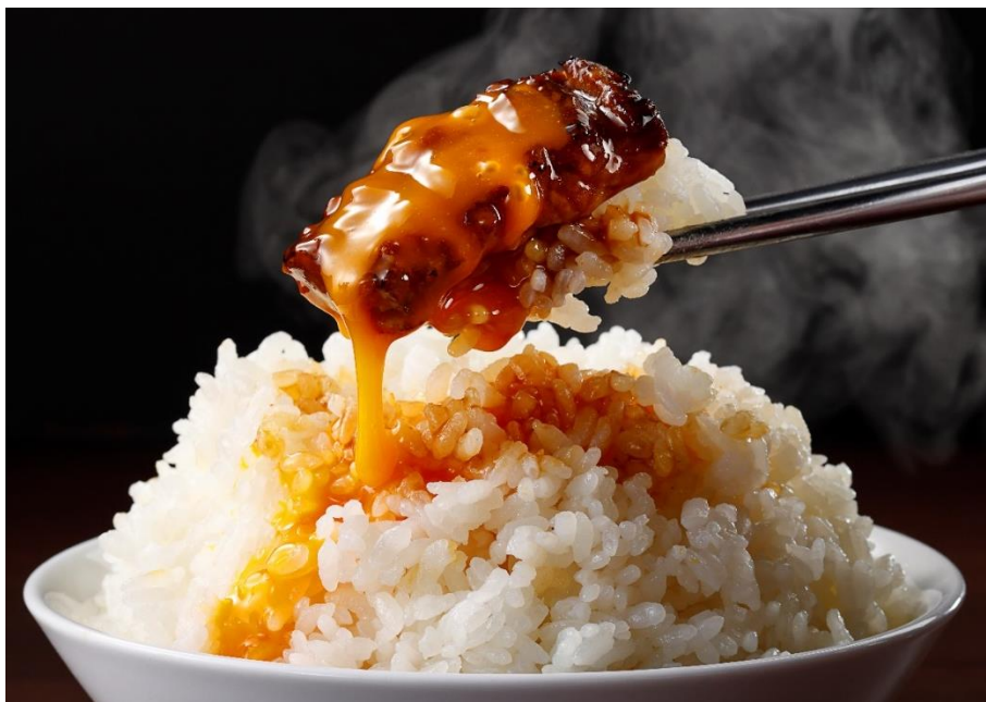
■熟成厚切り月見カルビ 580円(税込638円)

コロナグループの株式会社レイズインターナショナルが展開する牛角では、2022年9月8日(木)から10月31日(月)までの期間限定で、「秋の牛角フェア」を実施します。濃厚味噌ダレの厚切りカルビを卵にからめた熟成厚切り月見カルビ、贅沢な神戸牛の月見カルビ、たっぷりチーズをかけた石焼ビビンバ、旨味たっぷり芳醇しみラーメン、くちどけなめらかなモンブランアイスの5種メニューを販売します。