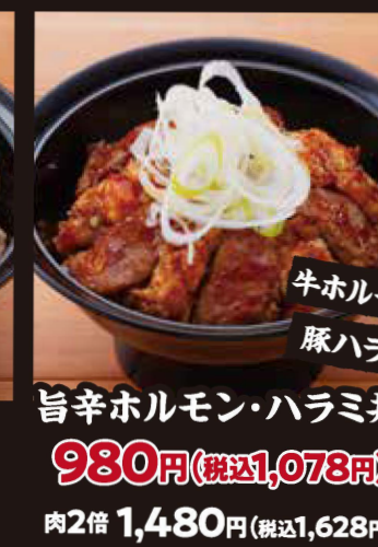
旨辛ホルモン・ハラミ丼