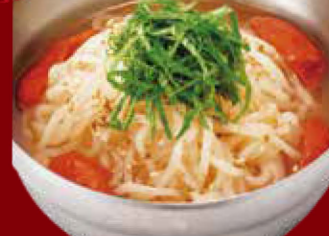
ミニ梅しそ冷麺セット