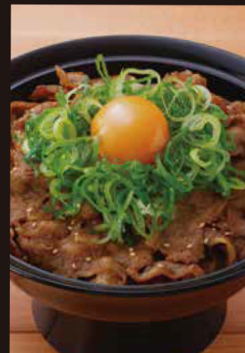
ねぎたま牛カルビ丼