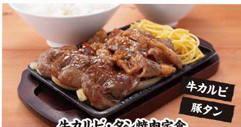
牛カルビ・タン焼肉定食