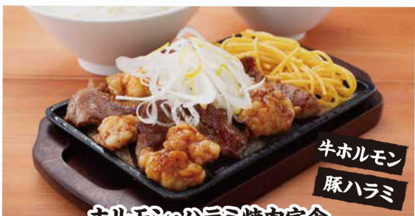
ホルモン・ハラミ焼肉定食