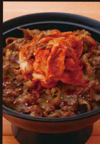
キムチ牛カルビ丼