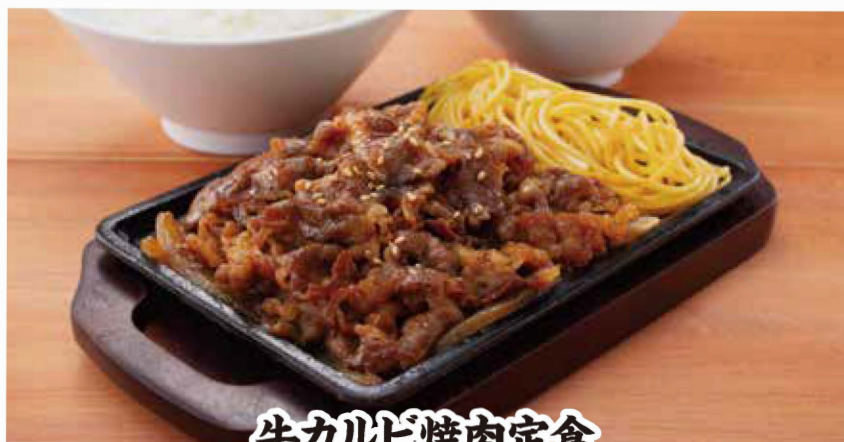
牛カルビ焼肉定食