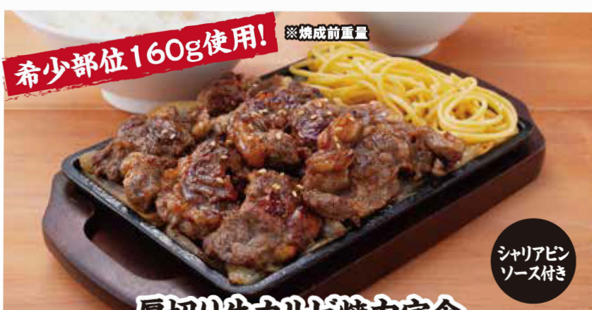
厚切り牛カルビ焼肉定食